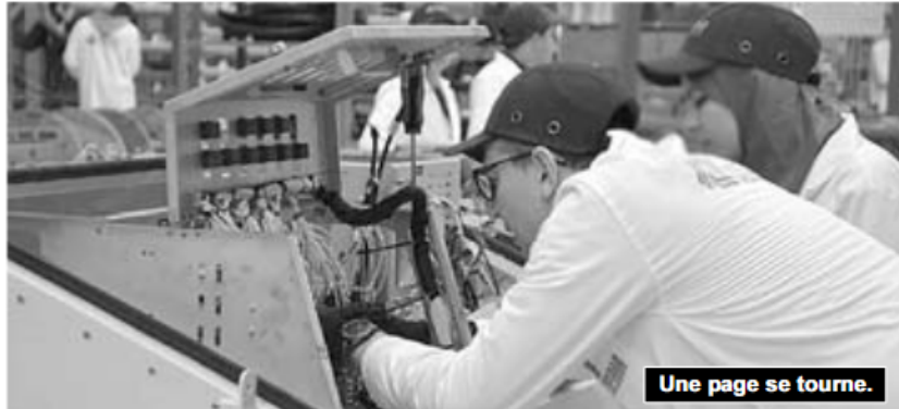
Une page se tourne.

Il fut dire que le potentiel de cette avancée s'édifie autour de la présentation, entre 2025 et 2026, de 76 prototypes finaux à 16 secteurs ministériels et la valorisation en cours de 54 projets nationaux et la création de 256 start-up universitaires, 2 466 microentreprises et dépôt de 3 249 brevets d'invention. Les produits et des résultats de recherche destinés à booster le fonctionnement et le rendement de secteurs stratégiques tels que l'agriculture, la santé, l'intelligence artificielle et l'industrie, pour ne citer que ceux-là. C'est ce qui renseigne sur l'importance que peut générer la commercialisation de ces futurs produits technologiques, notamment en tant qu'arguments de développement et de productivité, pour les établissements concernés dans cette configuration, le texte prévoit également des modalités précises de répartition des revenus générés avec des « pourcentages différenciés entre les différents acteurs ayant contribué aux travaux de recherche : enseignants-cher-